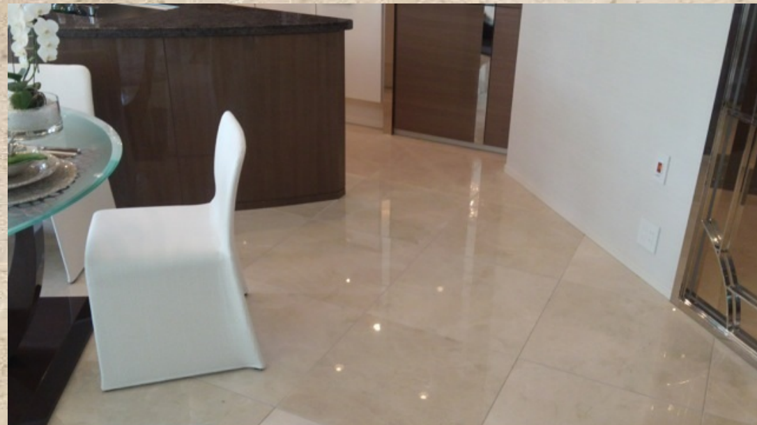
Akasaka 9 chome - Model Room