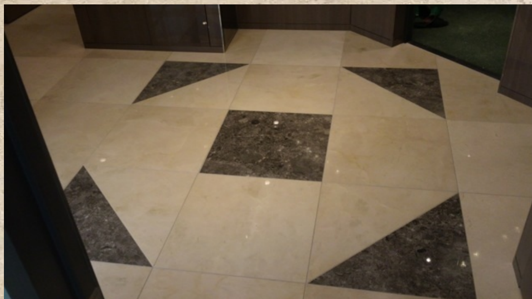
Akasaka 9 chome - Model Room