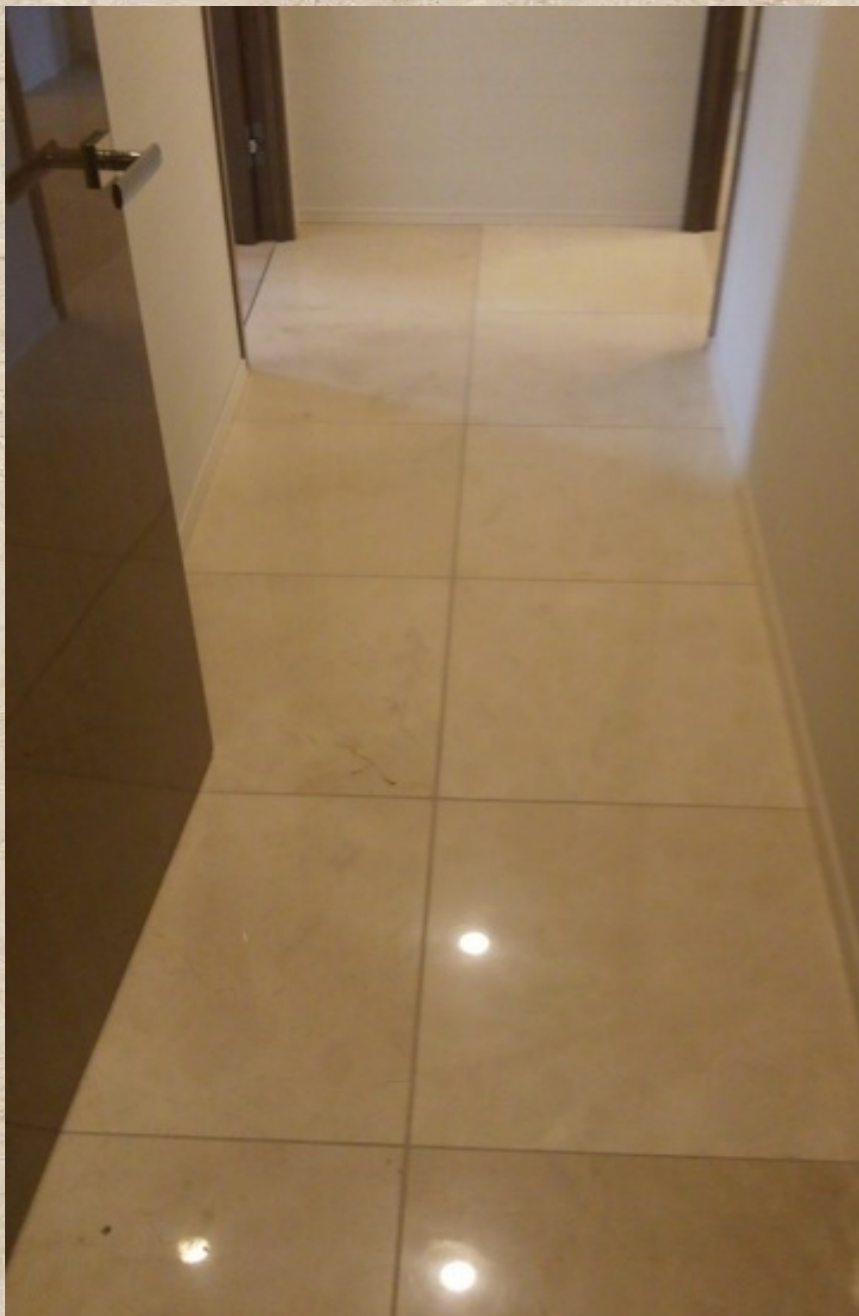
Akasaka 9 chome - Model Room