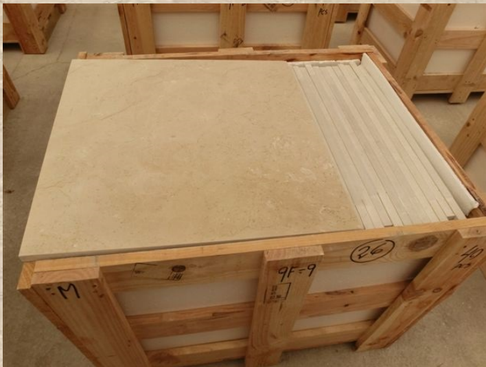
Crema Marfil 600x600mm Floor Tiles - 9th Floor

パークコート赤坂檜町ザ・タワーとして知られる赤坂 9 丁目タワープロジェクトは、三井不動産レジデンシャルが開発した高さ 170 メートル、44 階建ての都内屈指の高級タワーマンションで、世界的に有名な日本の建築家、隈研吾氏が設計した。2018 年 2 月に完成し、東京ミッドタウンの近く、檜町公園に隣接した立地にあります。このプロジェクトへの当社の参加は、スペインの有名なクレマ マーフィル大理石で作られた 600x600x20mm の床タイルの供給に重点を置いています。タワーの 4 階から 39 階に及ぶこの作業を成功させるには、13 個のコンテナで合計 5,000 平方メートル以上のタイルを輸送する必要がありました。