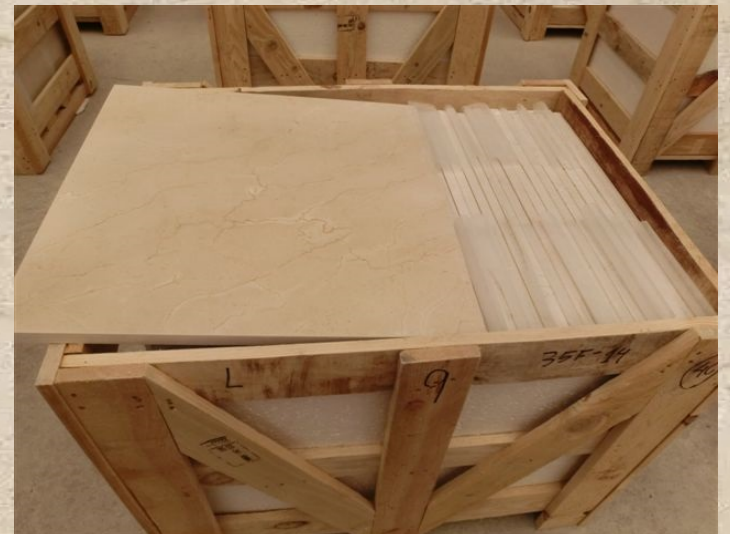
Crema Marfil 600x600mm Floor Tiles - 35th Floor