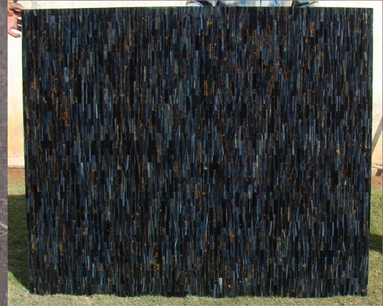
Blue Tiger Eye Gemstone Panel - St. Regis Hotel Osaka