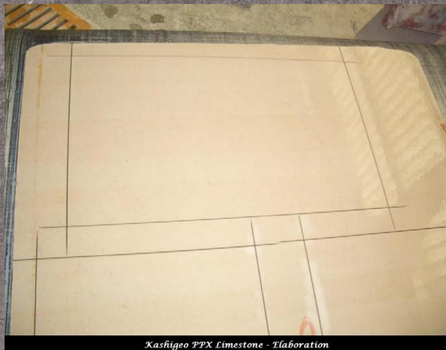
Kashigeo PPX Limestone - Flabration