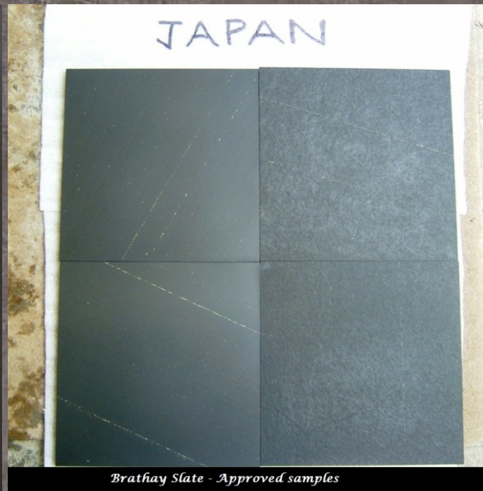
Brathay Slate - Approved samples