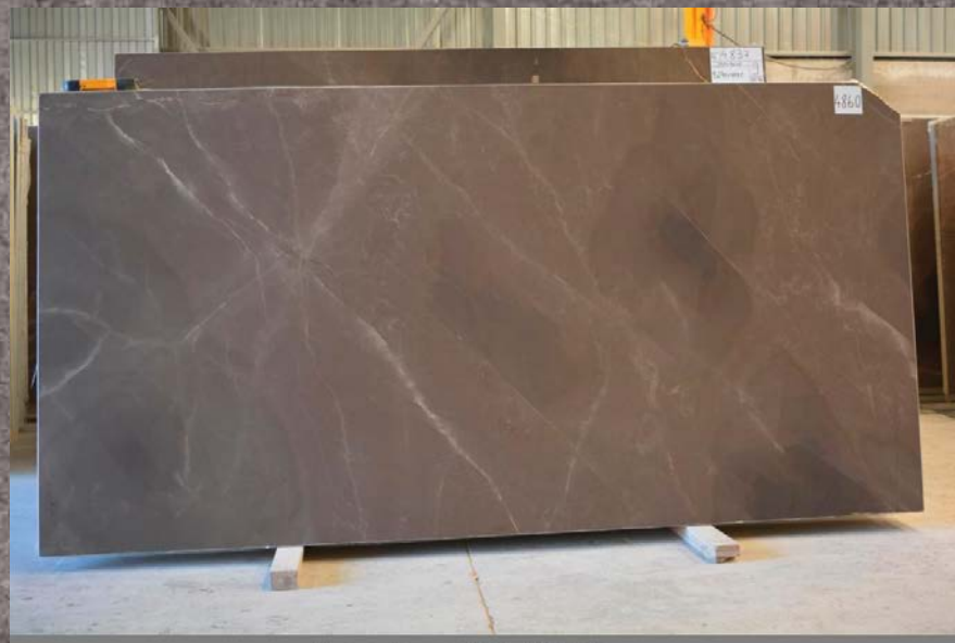
Bronze Armani Marble Slabs