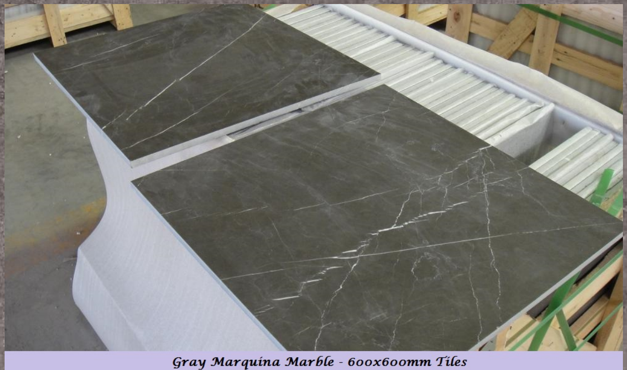
Gray Marquina Marble - 600x600mm Tiles