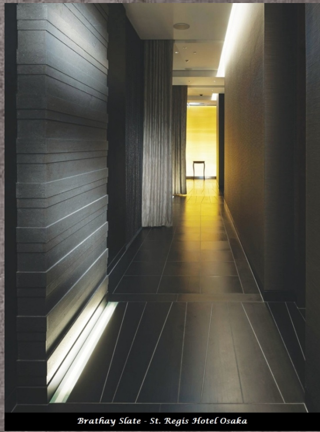
Brathay Slate - St. Regis Hotel Osaka